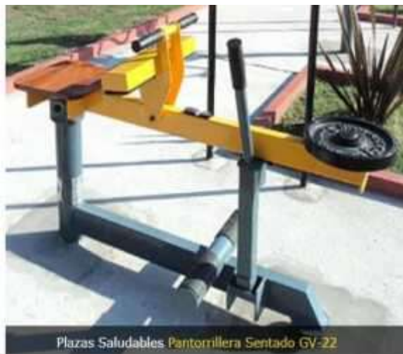
Plazas Saludables Pantorrillera Sentado GV-22

Banco para ejercitar gemelos por peso muerto aplicado sobre las rodillas, con mecanismo de liberación de carga.